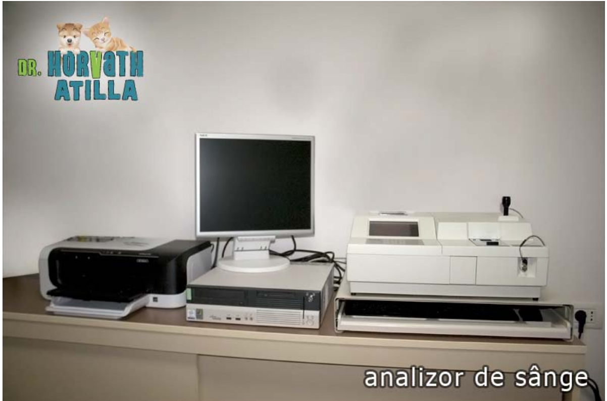
analizor de sânge